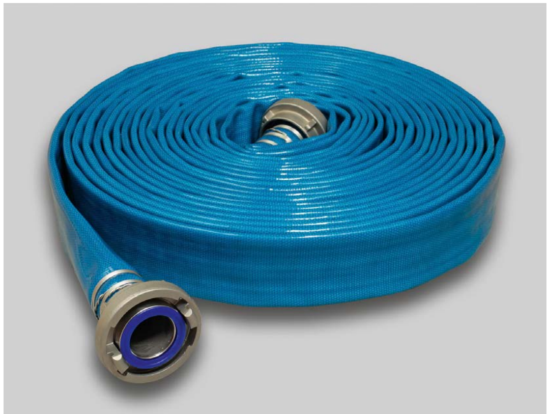
Syntex Eschbach Aquadur (innen und außen Polyurethan)

Der Fertigungsdurchmesser des Schlauches wird durch einen Hohlkegel im Zentrum des Webringens festgelegt