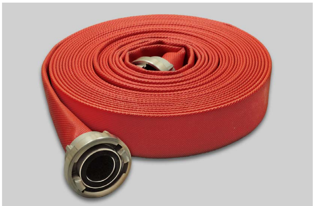
Feuerwehrschauch Syntex 2F und Syntex 3F PU rot

Um den hohen Qualitätsstandard abzusichern sind fortlaufende Qualitäts- prüfungen unabdingbar