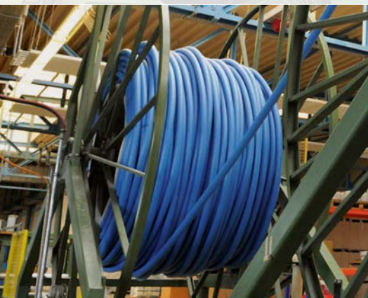
Verarbeitung auf der Endlosanlage in unbeschichteter und beschichteter Ausführung möglich