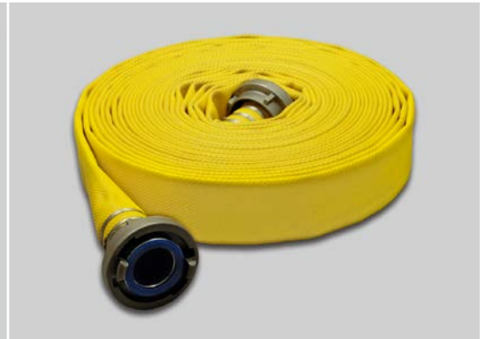
Syntex Aquaris LBM farbig beschichtet