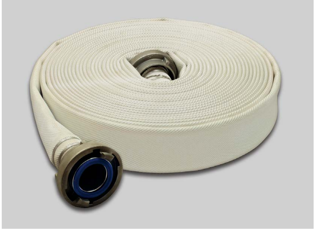
Syntex Aquaris LBM natur-weiß