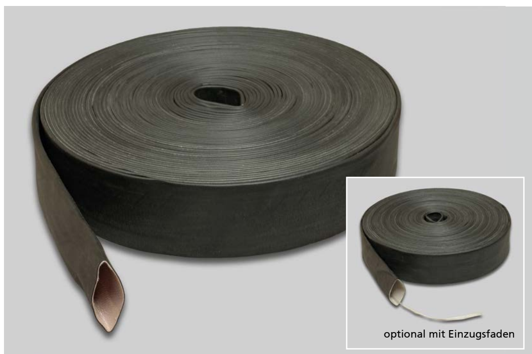
optional mit Einzugsfaden