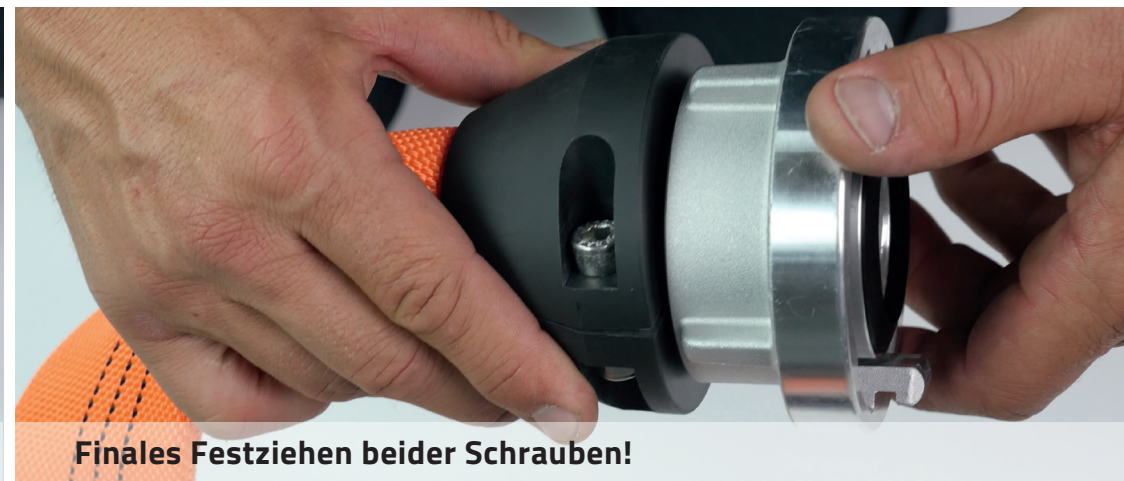
Finales Festziehen beider Schrauben!

Die visionäre Lösung für den Einband der Zukunft