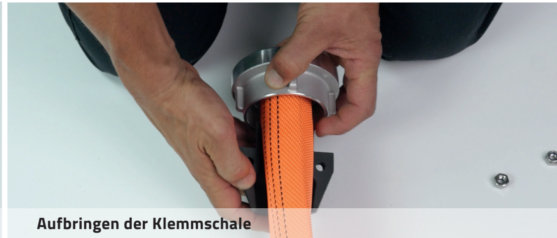
Aufbringen der Klemmschale