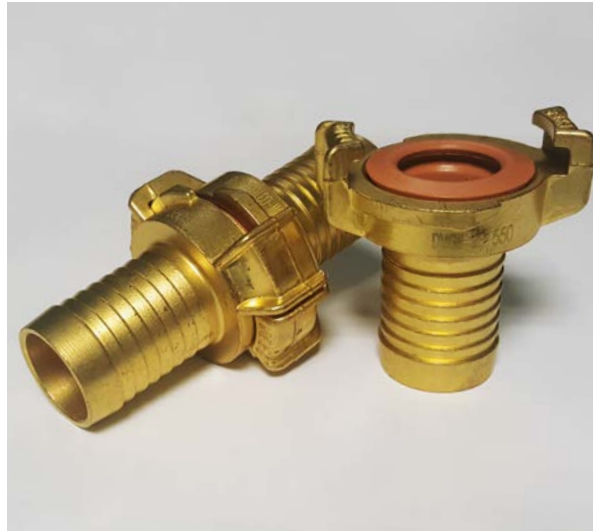
MS-GEKA®PLUS-Klauenkupplung mit DVGW-zugelassener Dichtung (NBR)