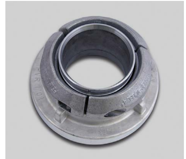
Klemmring-Kupplung mit 3-teiligem Klemmring- Einband (Stutzen in VA) und DVGW-zugelassener Dichtung (Silikon)

Die OSW empfiehlt bei Storzkupplungen als Kupplungsmaterial Edelstahl (1.4581 - 316Ti) sowie bei Gekakupplungen als Kupplungsmaterial Messing (CW617N) zu verwenden, da diese auf der Positivliste des Bundesumweltamtes (§ 17 Absatz 3 Satz 2 Nummer 3 TrinkwV 2001) für metallenen Werkstoffe mit aufgeführt und somit für den Einsatz im Trinkwasserbereich geeignet sind! Des Weiteren weisen wir darauf hin, das Leichtmetall nicht auf dieser Positivliste aufgeführt ist und somit durch uns nur auf Kundenwunsch eingebunden wird.