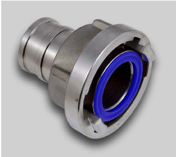
VA-Storz-Schlauchkupplung mit DVGW-zugelassener Dichtung (Silikon)