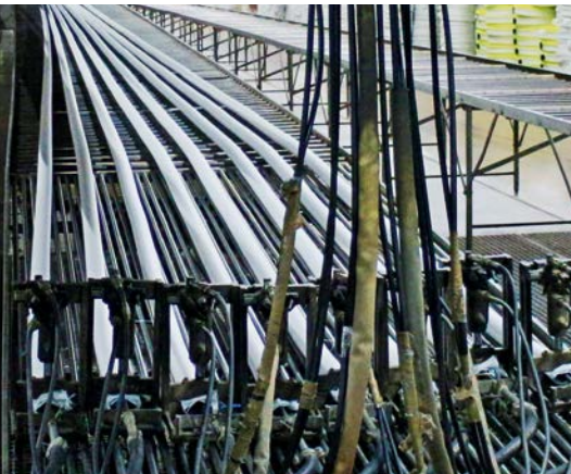
Vulkanisationsprozess auf 60 m langem Heiztisch