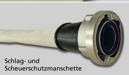
Schlag- und Scheuerschutzmanschette