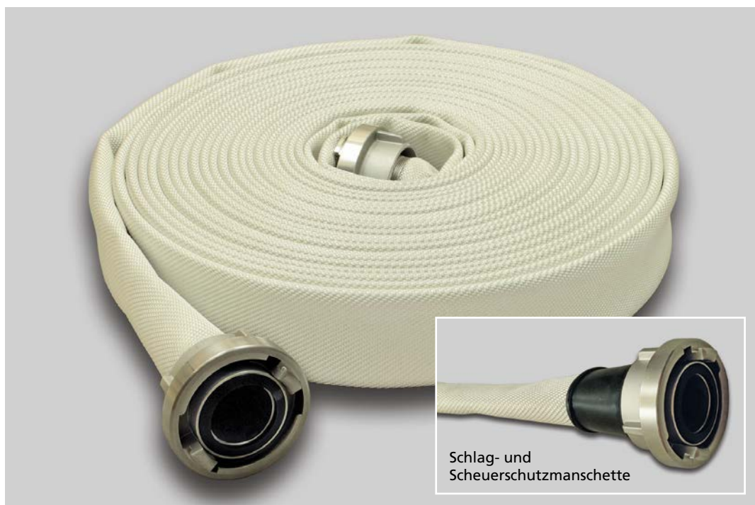
Feuerwehrschauch Syntex 2F und Syntex 3F natur-weiß

Zulassungen bzw. Prüfbescheinigungen senden wir Ihnen auf Nachfrage.