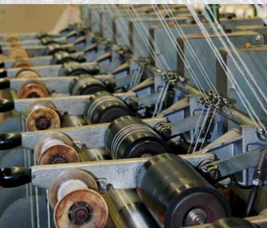
Zwirnvorgang der Kett- bzw. Schussfäden

Innengummierter Feuerlöschschlauch (umwebter Manchon)